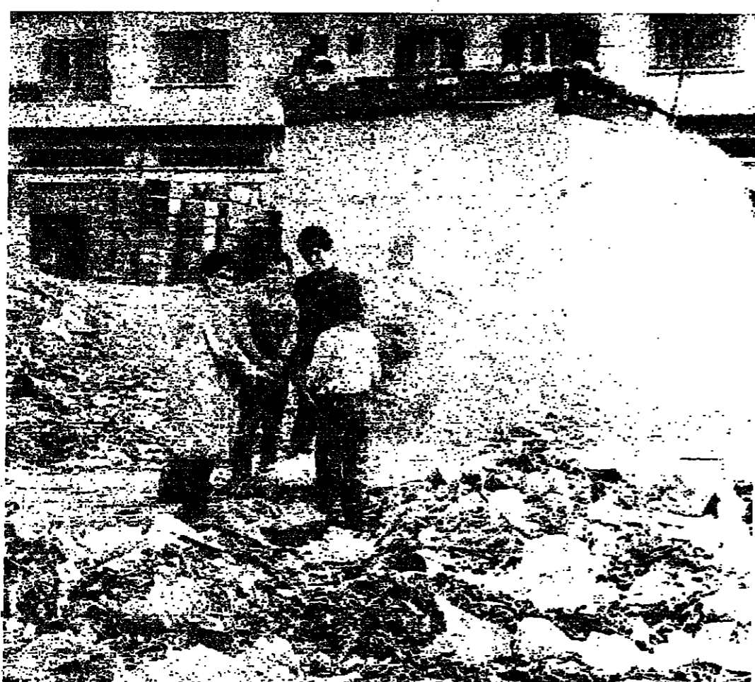
■ الاولاد مهذبون بالارثمة ■